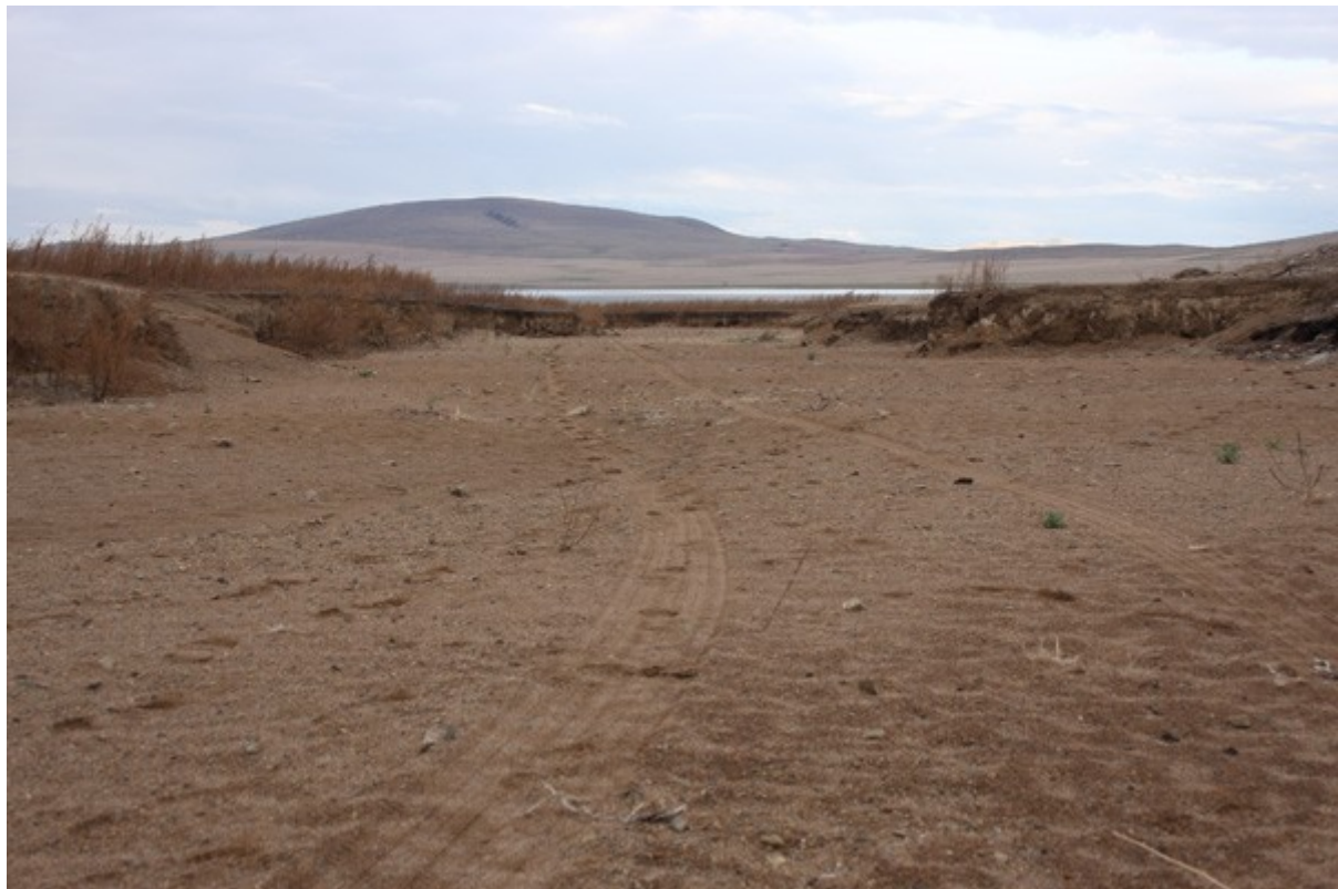
emplacement du camp 6 au bord du 2 ème lac de Beloozersk