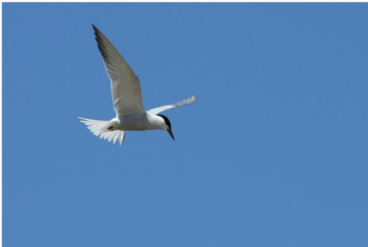
Sterne pierregarin ssp longipennis

Observée régulièrement le long des fleuves (Angara, Selenga), du lac Baïkal et du lac sud de Beloozersk. Une colonie de reproduction le 05/06 à Posolskoe (52°01'04"N – 106°10'36"E). Un oiseau au bec rouge et noir rappelant la ssp. hirundo a été observé le 09/06 à Novoselenginsk, sur un petit affluent de la Selenga.