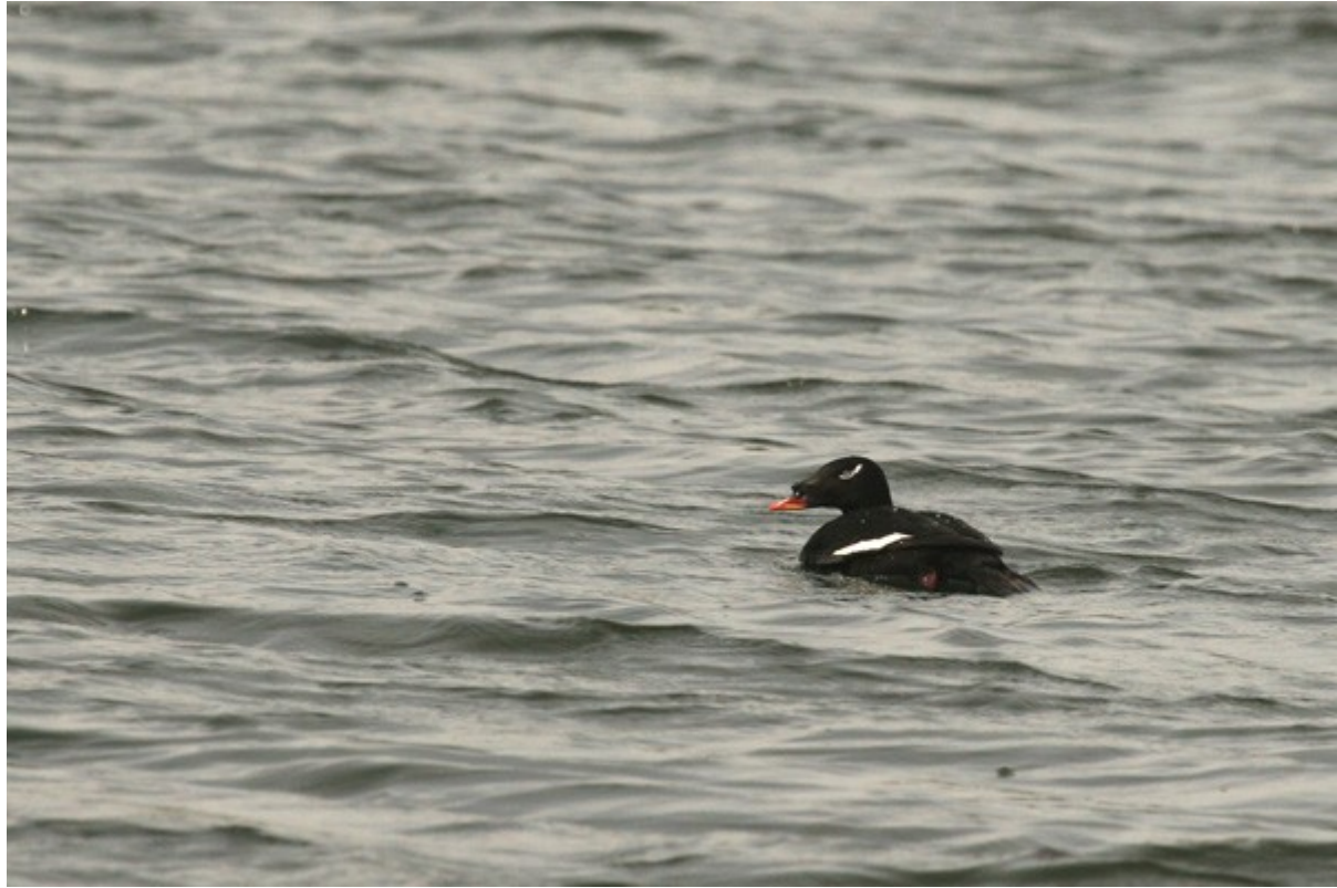
Macreuse à ailes blanches ssp stejnegeri

Nous installons notre 4 ème campement près de Beregovaya. Nous y trouvons un Rosignol siffleur , une Grue demoiselle , un Faucon hobereau , plusieurs Tourterelles orientales ainsi qu'un dortoir d' Hirondelles de rivages ( Riparia riparia transbaikalensis ) ou Hirondelles pâles ( Riparia diluta ).