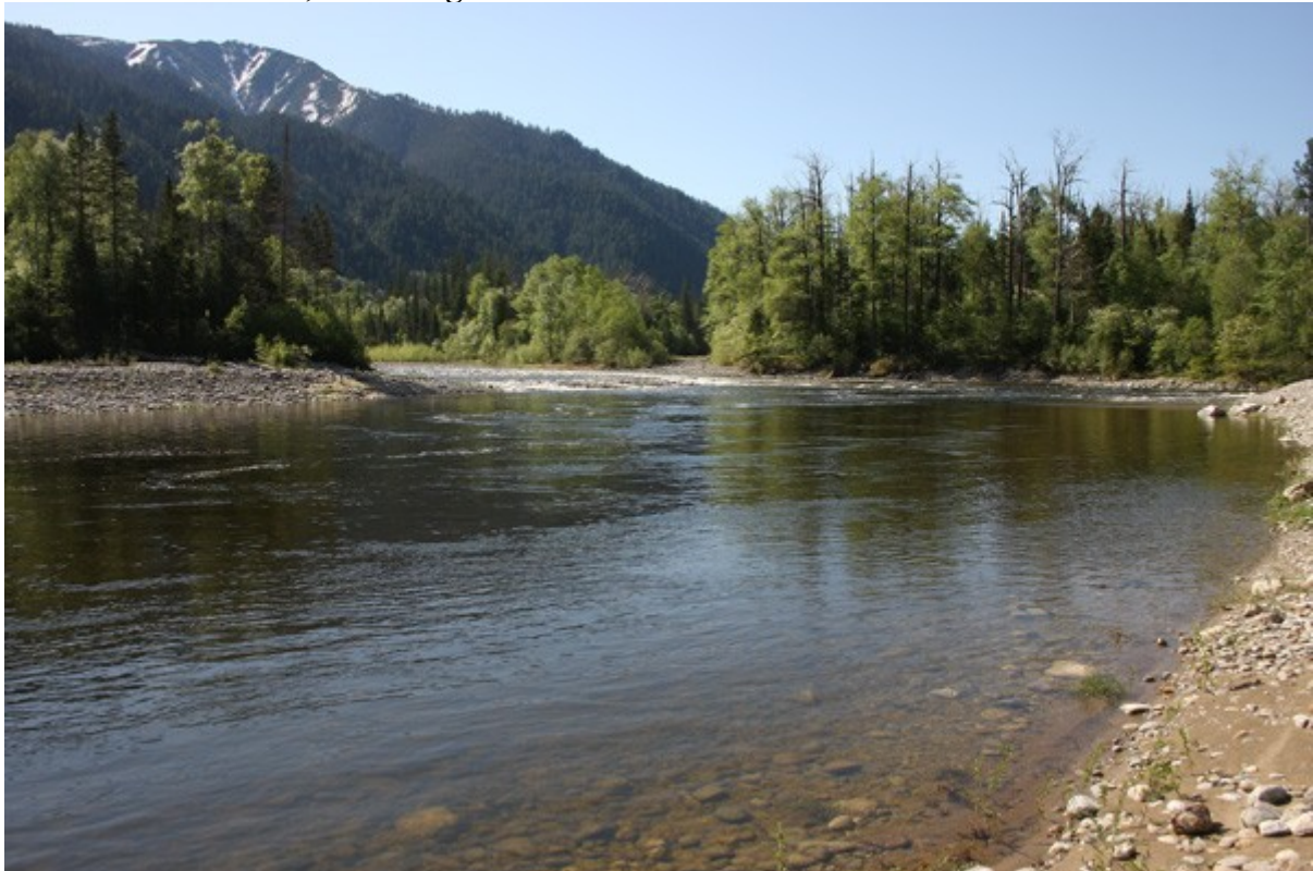
Rivière Snegnaja à Teplie Ozera

Dés notre arrivée, une rapide ballade nous permet d'observer un Tamia de Sibérie et côté oiseaux : un mâle de Bruant roux , un Rosignol siffleur et un Pinson des arbres .