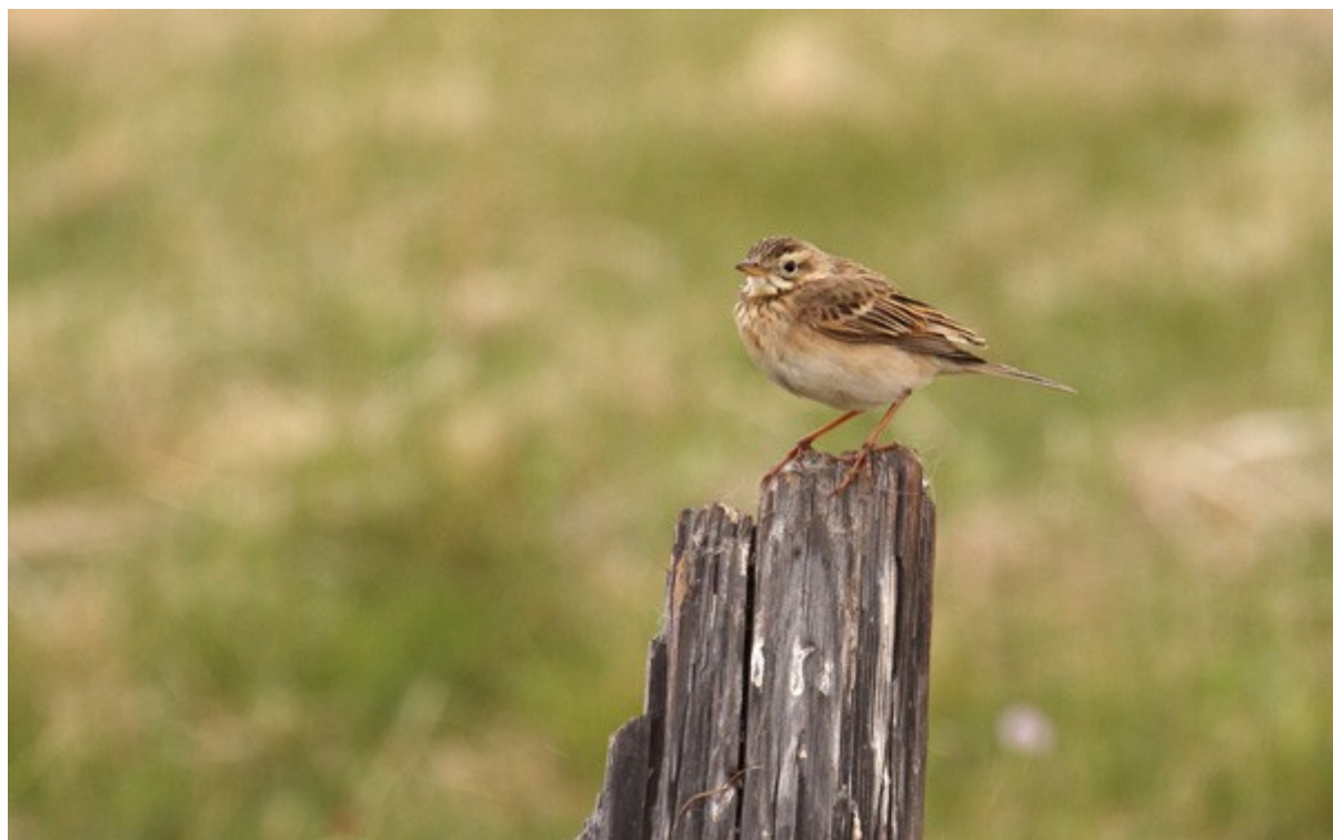
Pipit de Richard

1 chanteur le 01/06 sur la M55 avant Tory (51°47'35"N – 103°11'07"E), plusieurs chanteurs près d'Arshan le 01/06 (51°49'15"N – 102°31'00"E), plus de 10 le 02/06 au campement 2, 4 le 05/06 à Posolskoe (52°01'04"N – 106°10'36"E), 2 le 06/06 dans le delta de la Selenga (52°09'45"N – 106°23'07"E), 1 ce même jour dans le delta de la Selenga (52°04'12"N – 106°14'15"E), plusieurs le 07/06 au lac d'Orongoï, au moins 1 le 07/06 sur les bords du lac nord de Beloozersk, au moins 5 le 08/06 sur les bords du lac sud de Beloozersk, 4+ le 11/06 à Pokrovka.