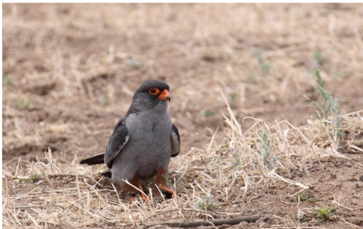
Faucon de l'Amour

1 mâle le 01/06 sur la M55 avant Tory (51°47'35"N – 103°11'07"E), 1 le 06/06 à Istok (52°06'17"N – 106°15'25"E), 1 le 07/06 à Yougovo (52°07'30"N – 107°06'17"E) et à Troytskoe (52°07'09"N – 107°09'25"E), 1 le 07/06 le long de l'A-165 (51°28'52"N – 106°45'31" E), 2 le 10/06 à Ulan-Ude.