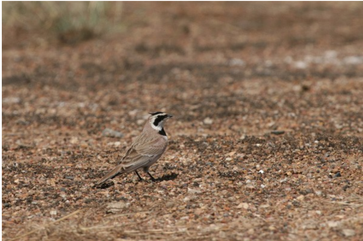
Alouette haussecol ss brandti

4 le 07/06 à Novoselenginsk (sortie sud-ouest du bourg), nombreuses le 08/06 sur les bords du lac nord de Beloozersk, 1 le 09/06 sur les bords du lac sud de Beloozersk.