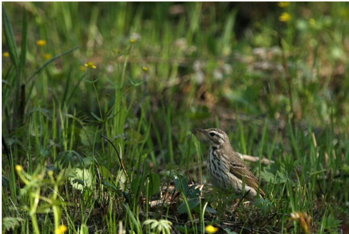
Pipit à dos olive

Au levé du soleil nous arpentons les alentours du campement constitué d'un petit ruisseau et de vallons recouvert d'une betulaie. Nous y observons au moins 5 Pipits à dos olive , 1 chanteur de Pouillot à pattes sombres , 2 Pouillots bruns , 1 Gobemouche de Sibérie , 5 Bruants masqués et 7 Pie-Grièches brunes . Nous entendons à plusieurs reprises les chants du Pic cendré et du Coucou oriental .